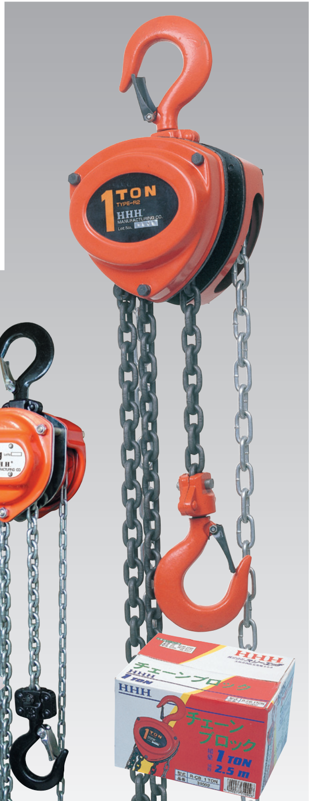
ステンレスチェーン チェーンブロック SCB0.5t