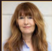
OONA HORX STRATHERN AT & IRE FUTURIST & AUTHOR