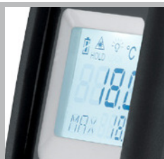
Pantalla LCD con iluminación