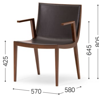
メイプル DW 参考革