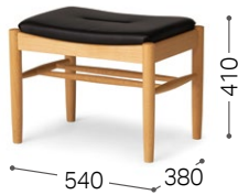
② 北海道ナラ NF BQ-BL/L3