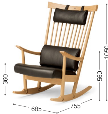
① 北海道ナラ NF BQ-BL/L3