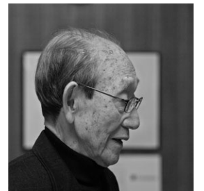
渡辺力 (1911-2013) WATANABE Riki 日本 / Japan