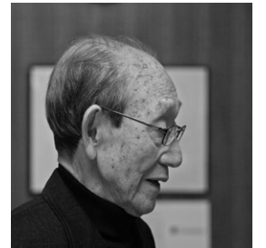
渡辺力 (1911-2013) WATANABE Riki 日本 / Japan