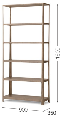
③ 北海道タモ GY