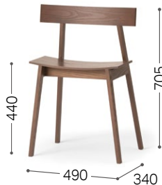
② 北海道タモ MBR