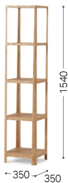
⑥ 北海道タモ NF