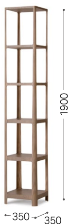
⑤ 北海道タモ GY