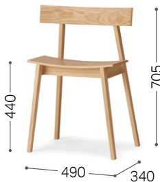
① 北海道タモ WNF