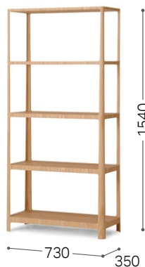
④ 北海道タモ WNF