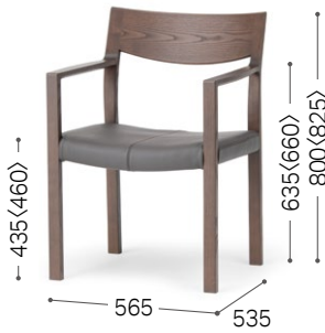
① 北海道タモ DBR MG-CGY/L3