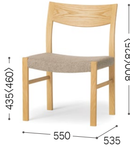
② 北海道タモ NF ブレンド LGY/F2