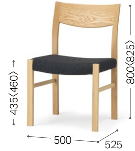
③ 北海道タモ WNF ライク NV/F3