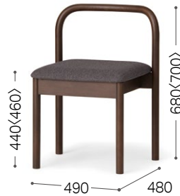
② 北海道ナラ DBR ライク DGY/F3