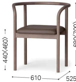
① 北海道ナラ GY MG-KGY/L3