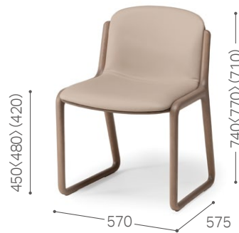
② 北海道ナラ GY MG-LGY/L3 (外張り：MG-KGY/L3)