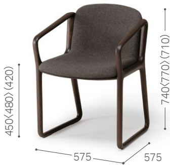
① 北海道ナラ DGY トニカ DGY/F4 (外張り：BQ-BL/L3)