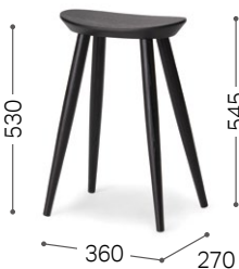
② 北海道タモ BL