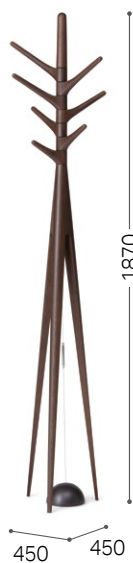
⑤ 北海道タモ DBR