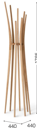
⑥ 北海道タモ WNF