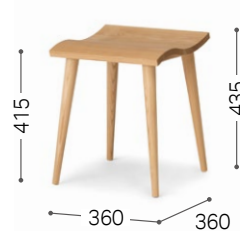
③ 北海道タモ NF