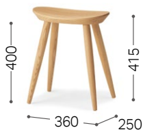
① 北海道タモ NF