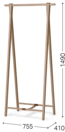
④ 北海道タモ GY