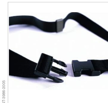
Lavado de seguridad