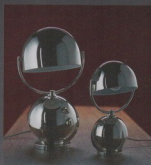
Lampes avec abat-jour orientable. Créations Félix Aublet, 1925, rééditées par Ecart International.