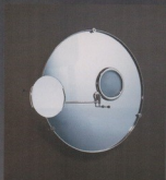
Miroir grossissant Satellite, créé pour la Villa E-1027. Création Eileen Gray, 1927, rééditée par Ecart International.