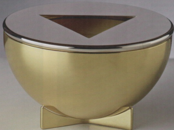
Cendrier MB24 en laiton et laiton nickelé. Création Marianne Brandt en 1924, rééditée par Tecnolumen chez Arteum. www.arteum.com et www.tecnolumen.com .