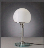
Créée dans les ateliers de l'École du Bauhaus, lampe WG 24, en métal et verre soufflé. Création Wilhelm Wagenfeld, en 1923-1924 éditée par Tecnolumen, chez Arteum. www.arteum.com et www.tecnolumen.com .