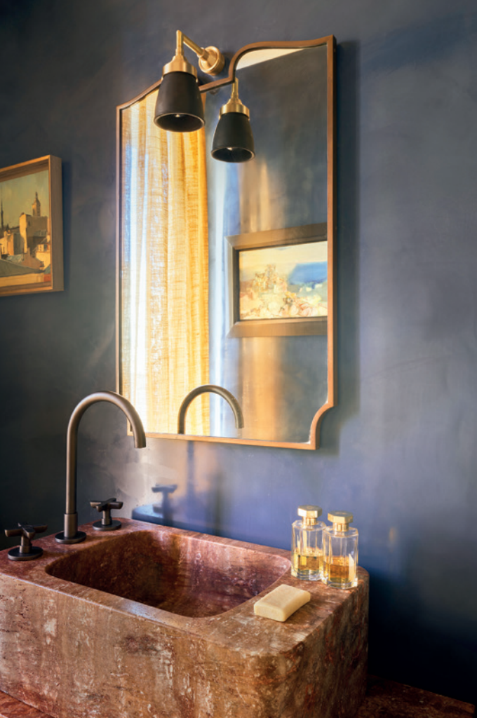
En el baño, lavabo de travertino rojo, grifería de Fartini y espejo diseño del estudio Marta de la Rica . Abajo, en el cuarto de la bañera, butaca retapizada con tela de Dedar .