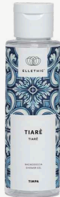
Size: 100 ml