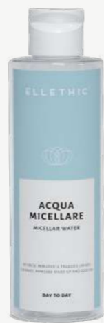
Size: 200 ml