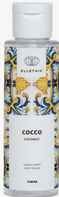
Size: 100 ml