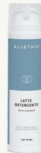
Size: 200 ml