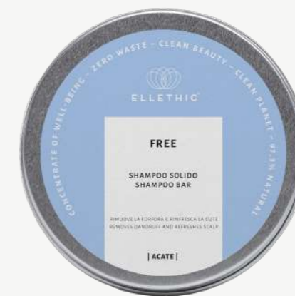
Size: 120 g