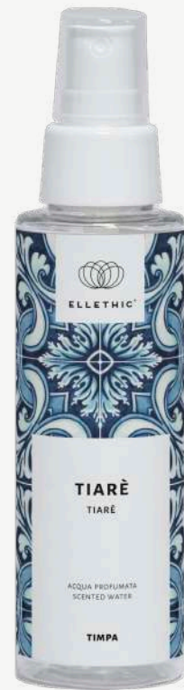
Size: 100 ml

Prodotti dall'intenso ma delicato profumo floreale di Tiarè che fa sognare un viaggio in un posto lontano.