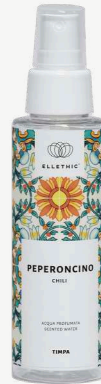
Size: 100 ml

Prodotti alla fragranza piccante e pepata del Peperoncino associata alle frizzanti e inconfondibili note agrumate tipiche del Mediterraneo.