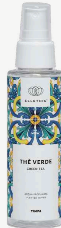
Size: 100 ml

Prodotti dalla profumazione fresca e leggera data dall'armonia perfetta tra note fruttate, fiorite e agrumate.