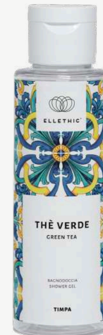
Size: 100 ml