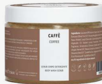
Size: 500 g