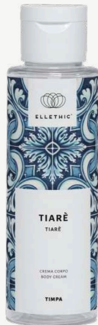
Size: 100 ml