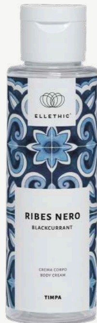
Size: 100 ml