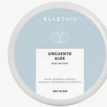
Size: 15 g