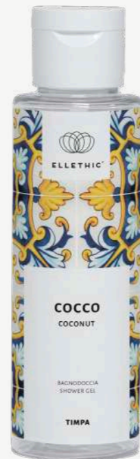
Size: 100 ml