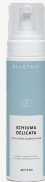
Size: 200 ml