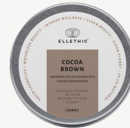
Size: 120 g