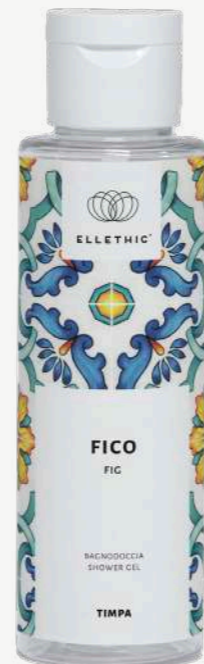
Size: 100 ml