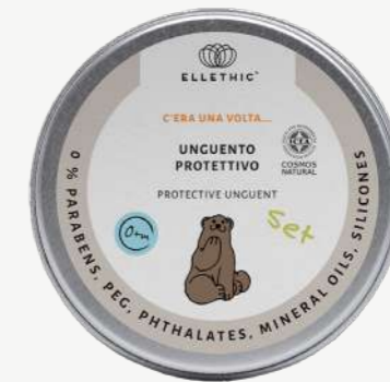
Size: 50 g