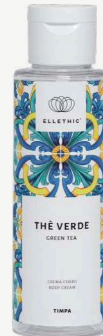
Size: 100 ml