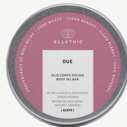
Size: 80 g