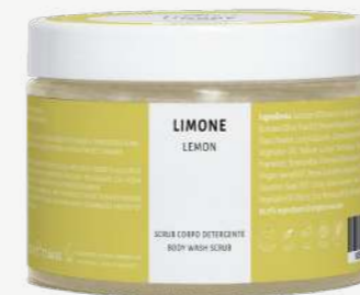
Size: 500 g