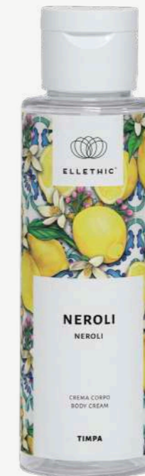
Size: 100 ml