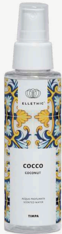
Size: 100 ml

Prodotti dalla profumazione esotica ed estiva grazie alle dolci note del Cocco.