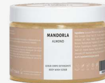
Size: 500 g