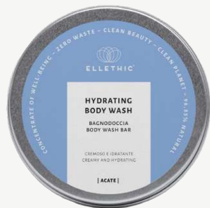
Size: 120 g