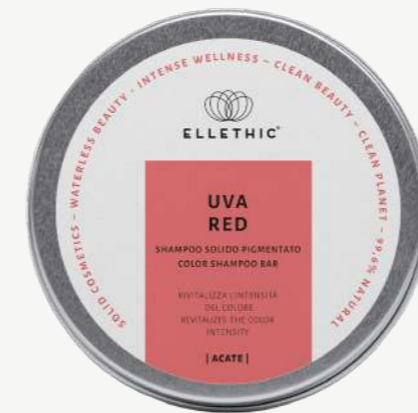
Size: 120 g