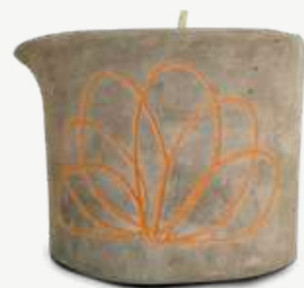
Size: 100 g