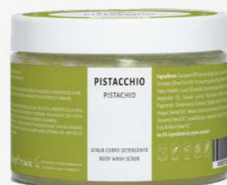
Size: 500 g