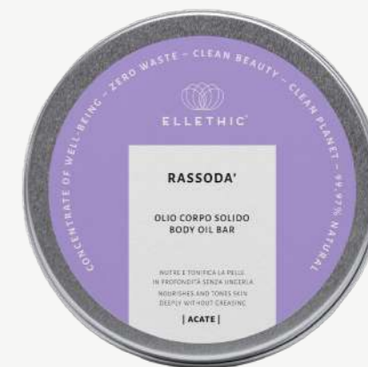
Size: 80 g