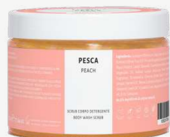
Size: 500 g