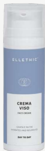
Size: 50 ml