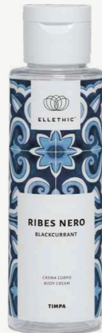
Size: 100 ml