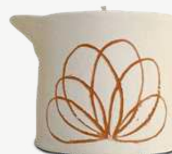
Size: 100 g

SODIUM BICARBONATE, CITRIC ACID, SODIUM COCOYL ISETHIONATE, ORYZA SATIVA (RICE) STARCH, TOCOPHEROL, PRUNUS AMYGDALUS DULCIS (SWEET ALMOND) OIL*, CHAMOMILLA RECUTITA (MATRICARIA) FLOWER EXTRACT*, AVENA SATIVA (OATS) LEAF/STALK EXTRACT*, HELIANTHUS ANNUUS (SUNFLOWER) SEED OIL*, OLEA EUROPAEA (OLIVE) FRUIT OIL*, SIMMONDSIA CHINENSIS (JOJOBA) SEED OIL*, RICINUS COMMUNIS (CASTOR) SEED OIL*, SESAMUM INDICUM (SESAME) SEED OIL*, ARGANIA SPINOSA (ARGAN) KERNEL OIL*, LAVANDULA ANGUSTIFOLIA (LAVENDER) OIL, MELALEUCA ALTERNIFOLIA (TEA TREE) LEAF OIL, ORIGANUM VULGARE (ORIGAN) OIL, MYRTUS COMMUNIS (MYRTLE) LEAF OIL, MENTHA PIPERITA (PEPPERMINT) OIL, CITRUS LIMON (LEMON) PEEL OIL, FOENICULUM VULGARE (FENNEL) OIL. *DA AGRICOLTURA BIOLOGICA - FROM ORGANIC FARMING