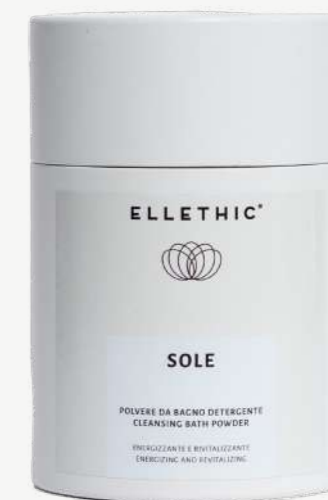
Size: 400 g