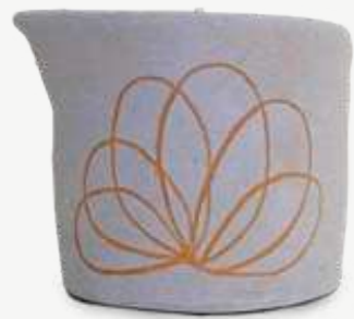
Size: 100 g