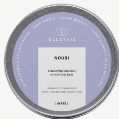
Size: 120 g