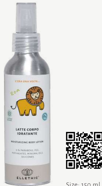
Size: 150 ml