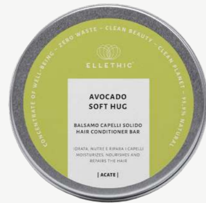
Size: 110 g