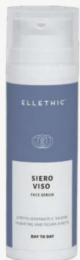
Size: 50 ml