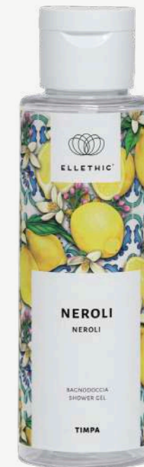
Size: 100 ml