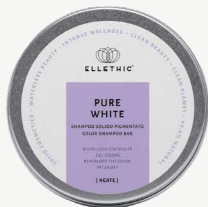
Size: 120 g