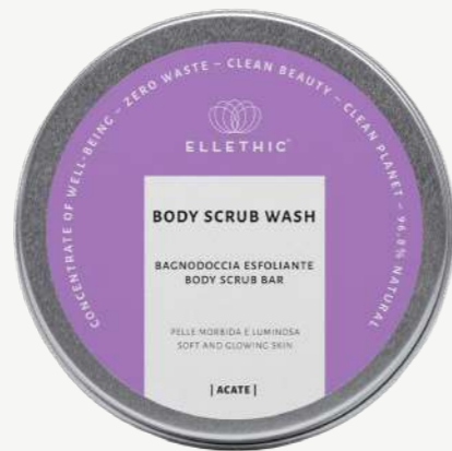
Size: 120 g