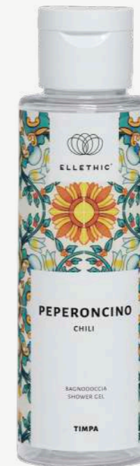
Size: 100 ml