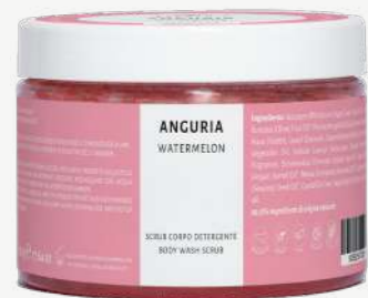
Size: 500 g