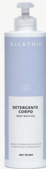
Size: 500 ml