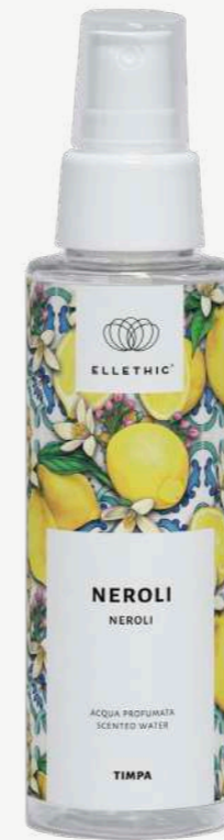
Size: 100 ml

Prodotti dalla peculiare profumazione floreale e agrumata data dall'unicità della fragranza Neroli estratta dai fiori dell'arancio amaro.