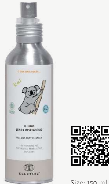
Size: 150 ml