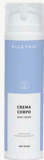
Size: 200 ml