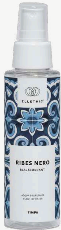
Size: 100 ml

Prodotti dalla profumazione fruttata, dolce e leggermente floreale. Sensuale e magnetica.