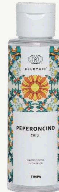
Size: 100 ml