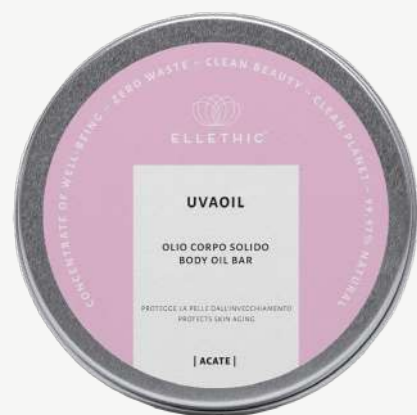
Size: 80 g