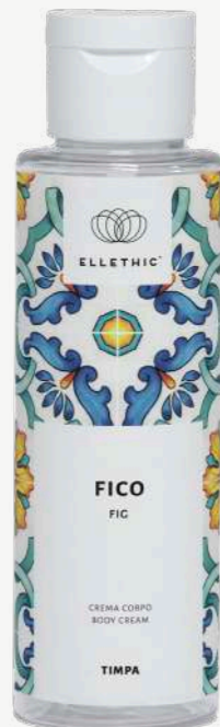
Size: 100 ml