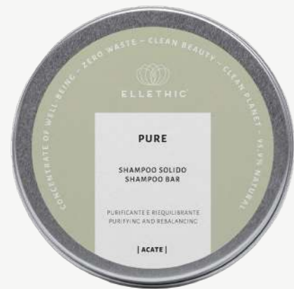
Size: 120 g