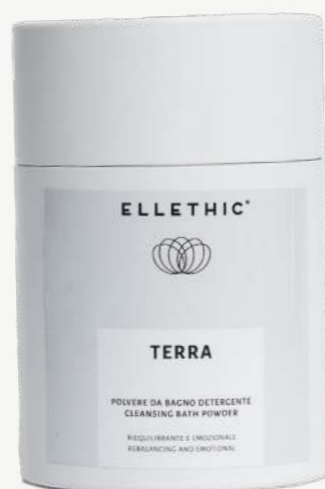
Size: 400 g