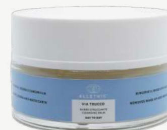
Size: 100 g