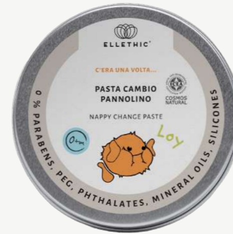
Size: 100 g