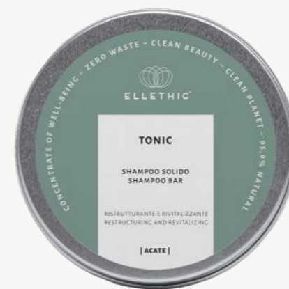
Size: 120 g