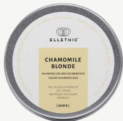
Size: 120 g