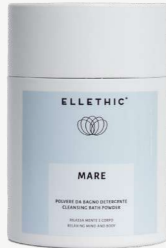
Size: 400 g