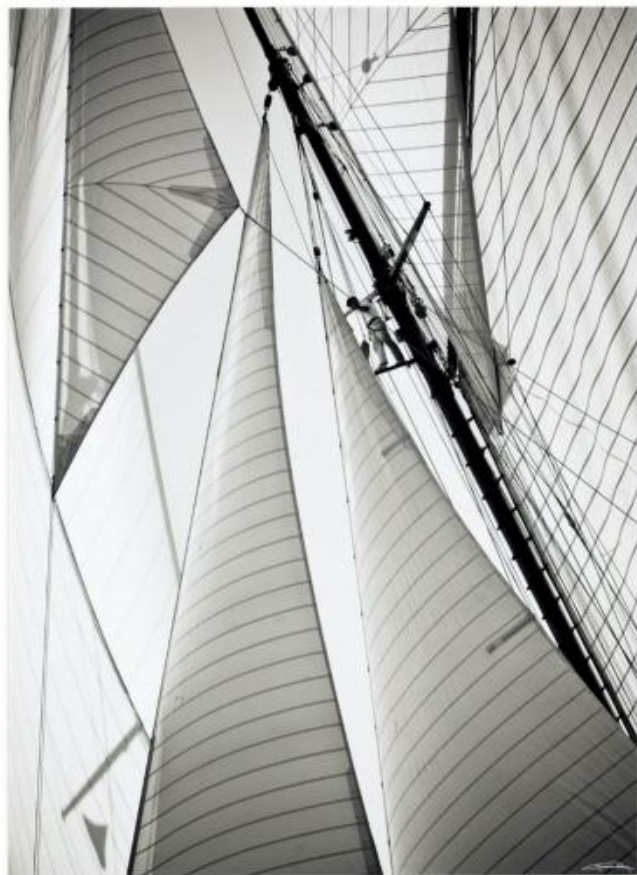
PEC 156 : 65x80 cm