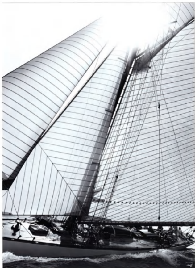
PEC 151 : 85x105 cm