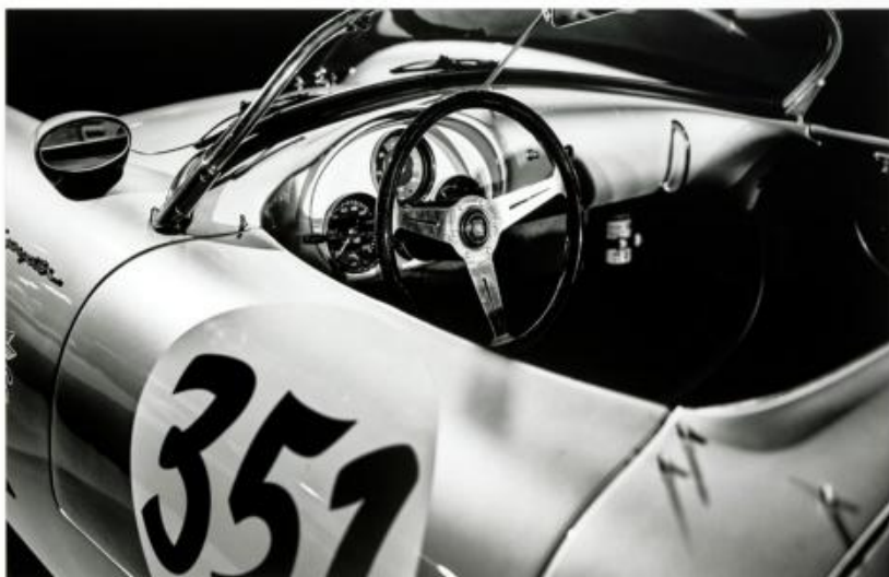
FSY 108 : 75x105 cm