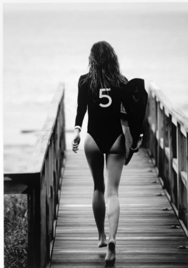
P 008 : 75X95 cm