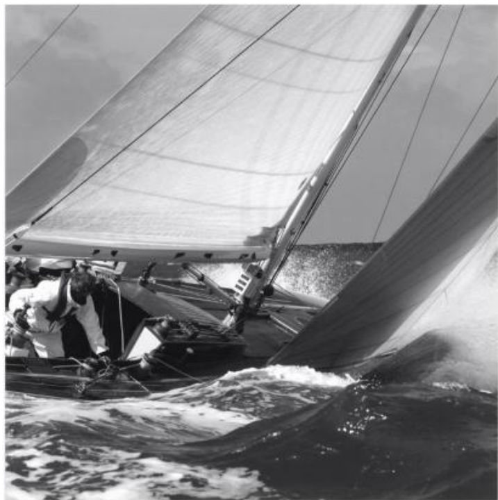
X 360 : 85x85 cm