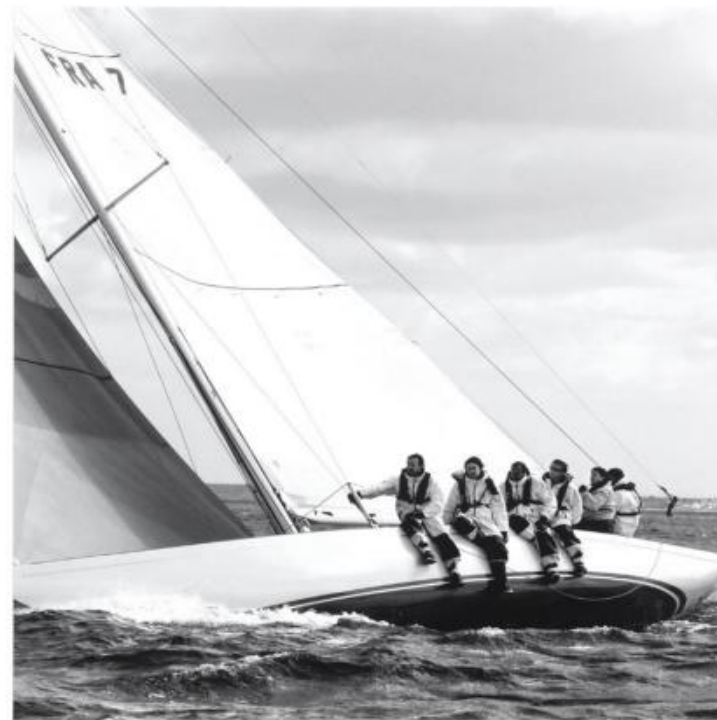
X 361 : 85x85 cm