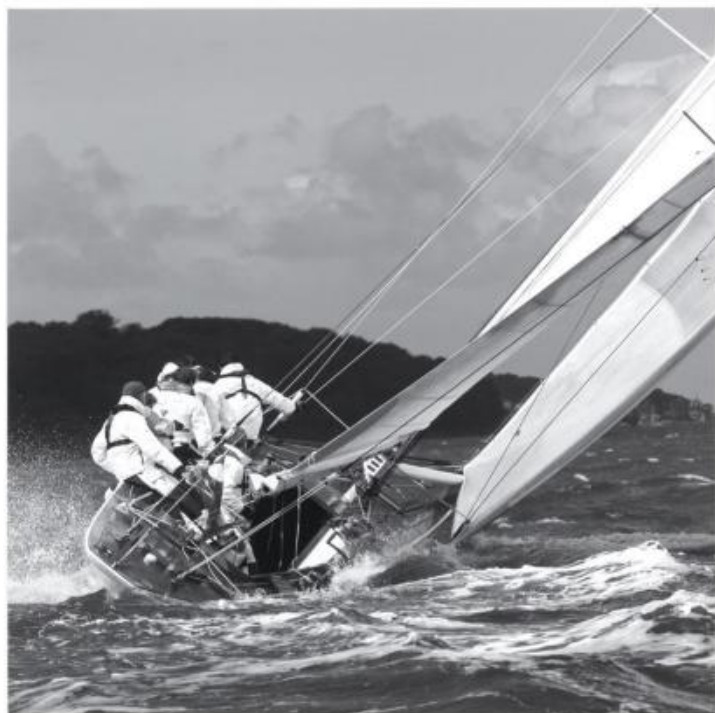
X 358 : 85x85 cm