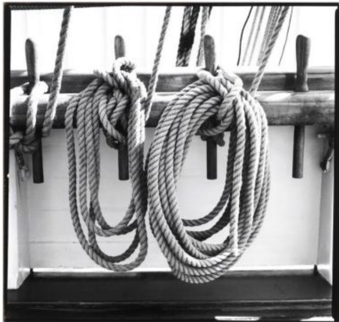
NY 833 : 62x62cm