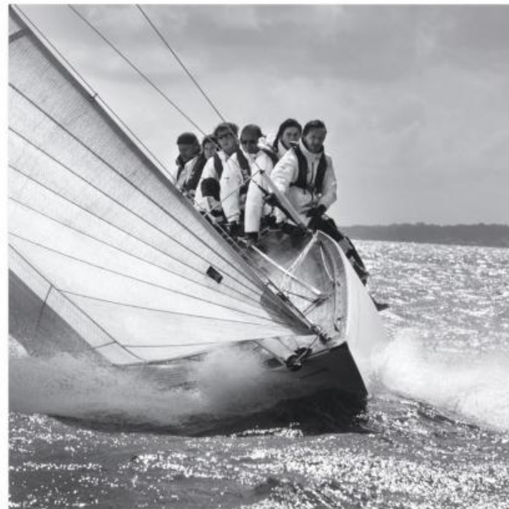
X 359 : 85x85 cm