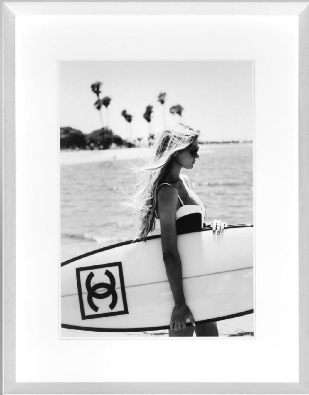
P 006 : 75X95 cm