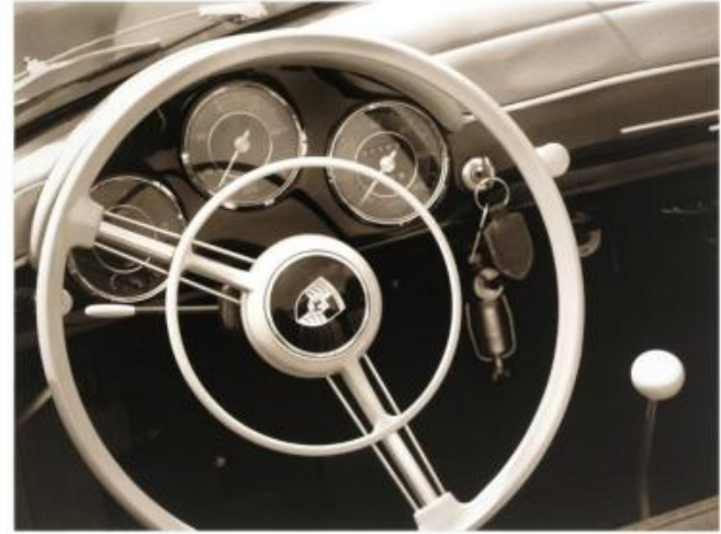
MC 015 : 52x62 cm