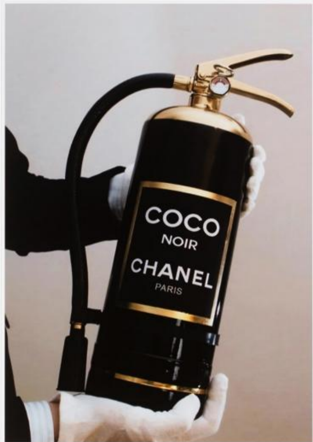
P 003 : 75X95 cm