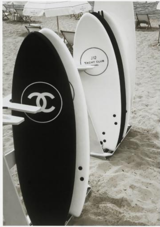
P 005 : 75X95 cm