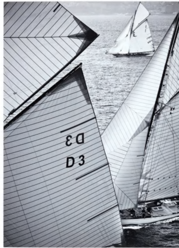
PEC 152 : 85x105 cm