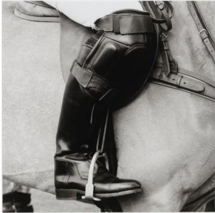
X 447: 70x70 cm