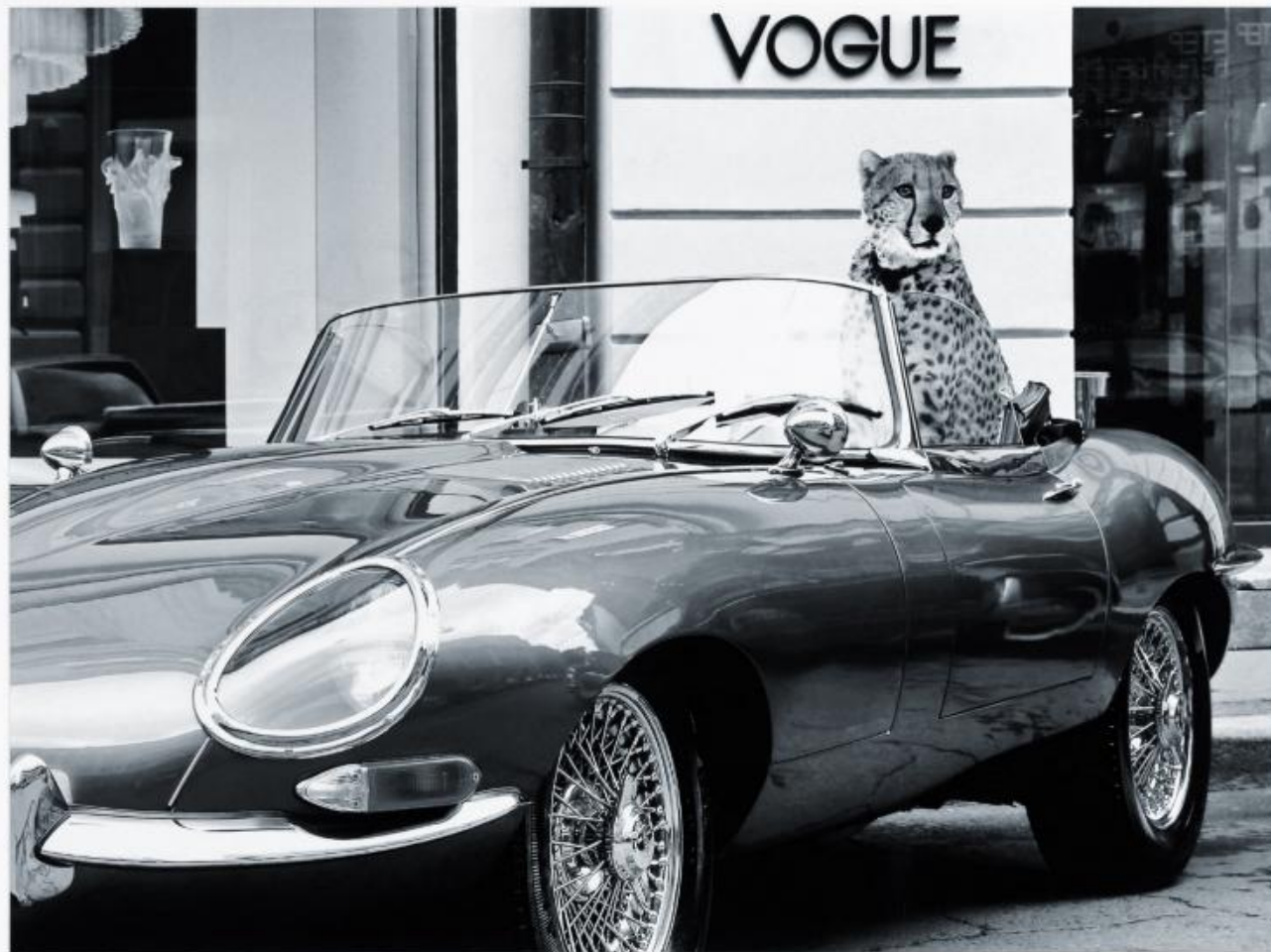
Q 224 : 85x105 cm