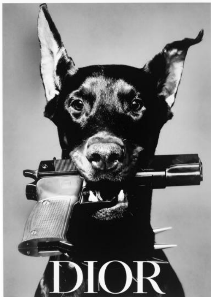
P 009 : 75X95 cm