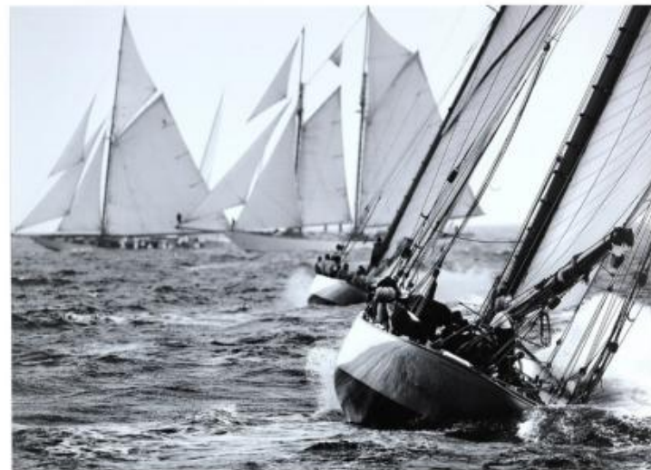
PEC 150 : 85x105 cm