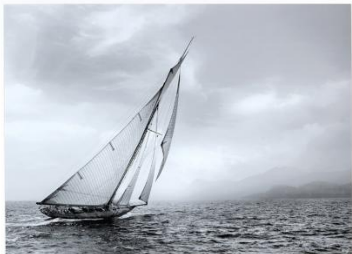
PEC 147 : 85x105 cm