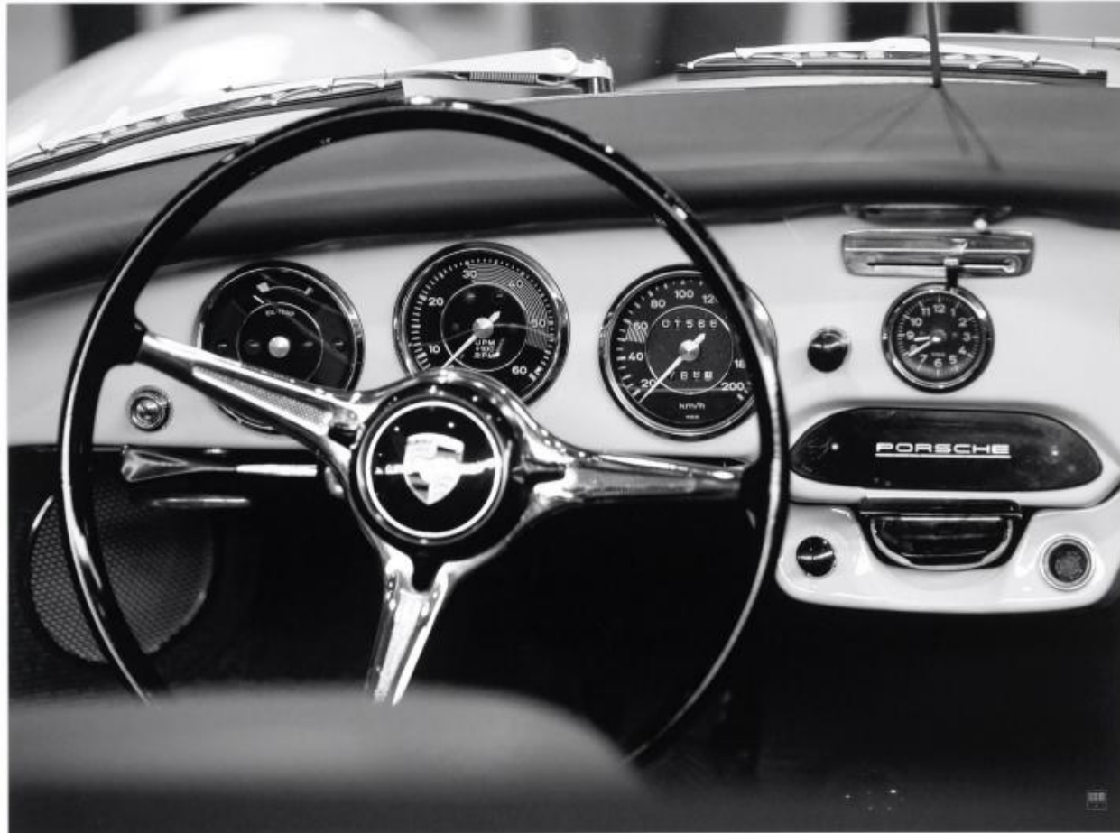
DA 558 : 85x105 cm