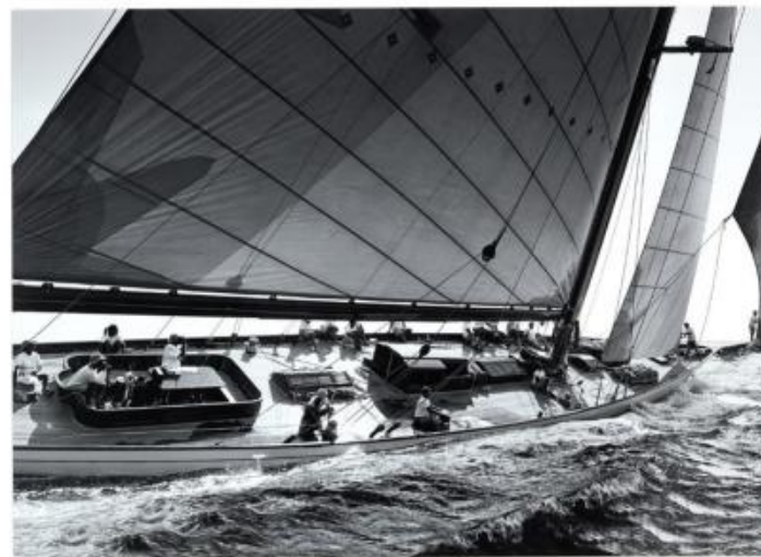
PEC 148 : 85x105 cm