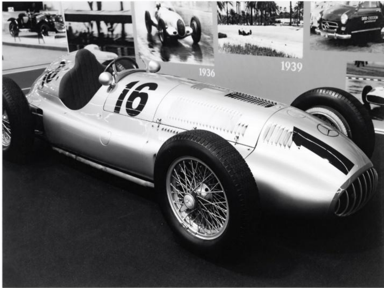
DA 560 : 85x105 cm