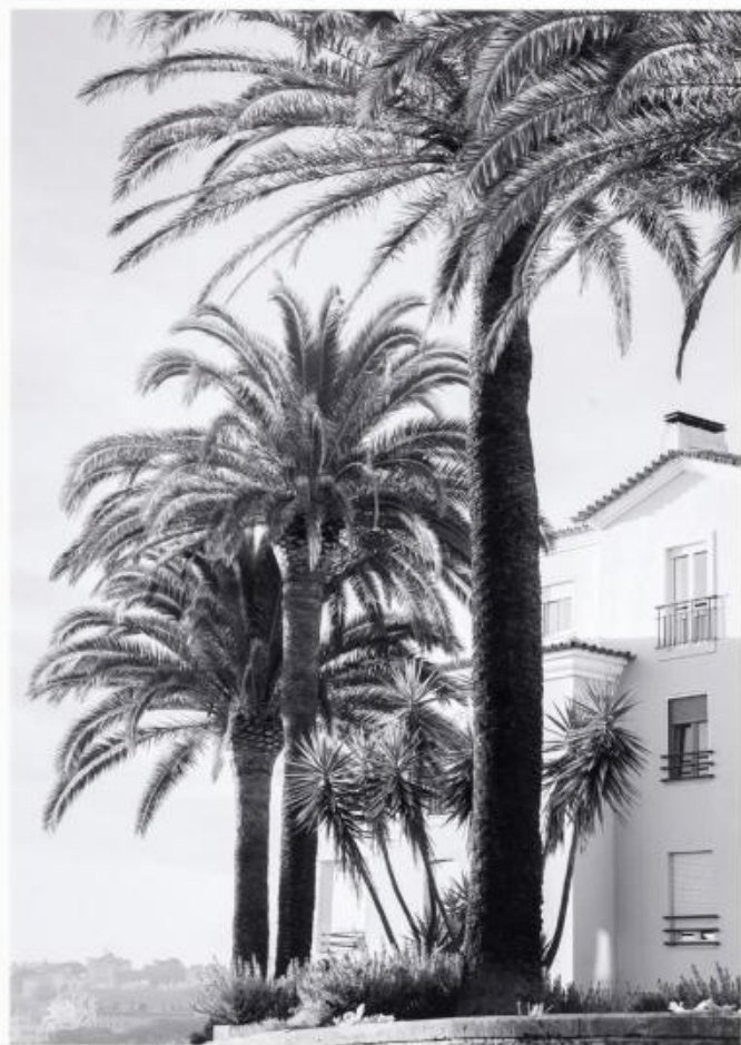
DA 500 : 75x95 cm