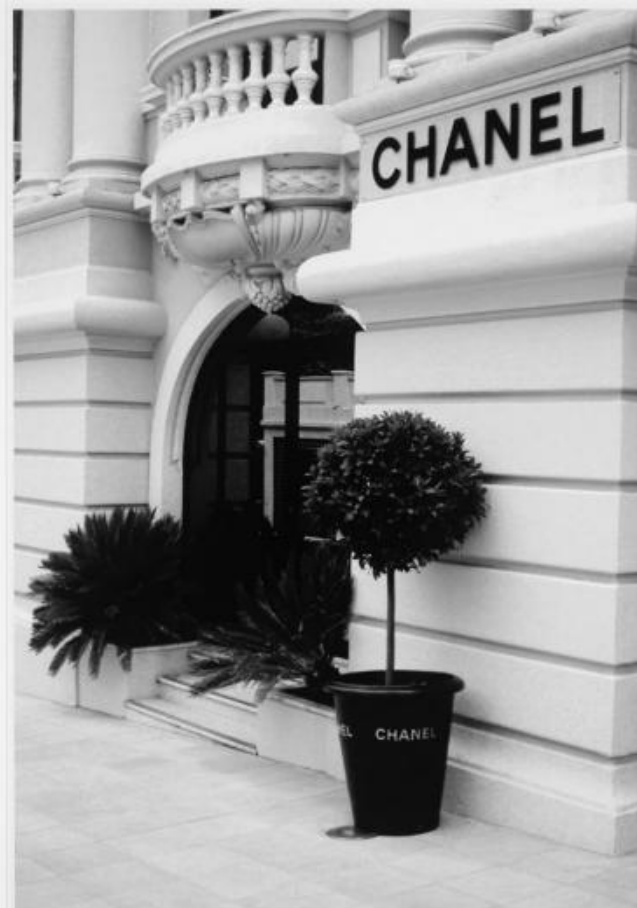
P 004 : 75X95 cm