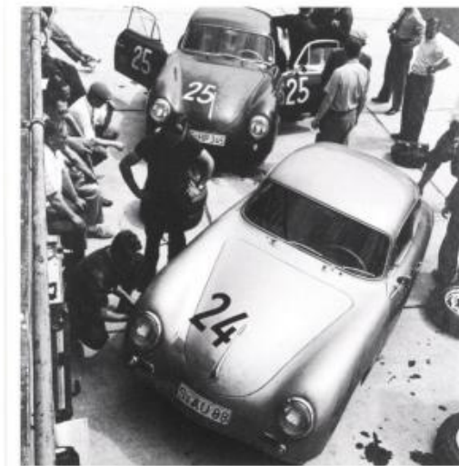
Y181: 32x32 cm (set van 2)