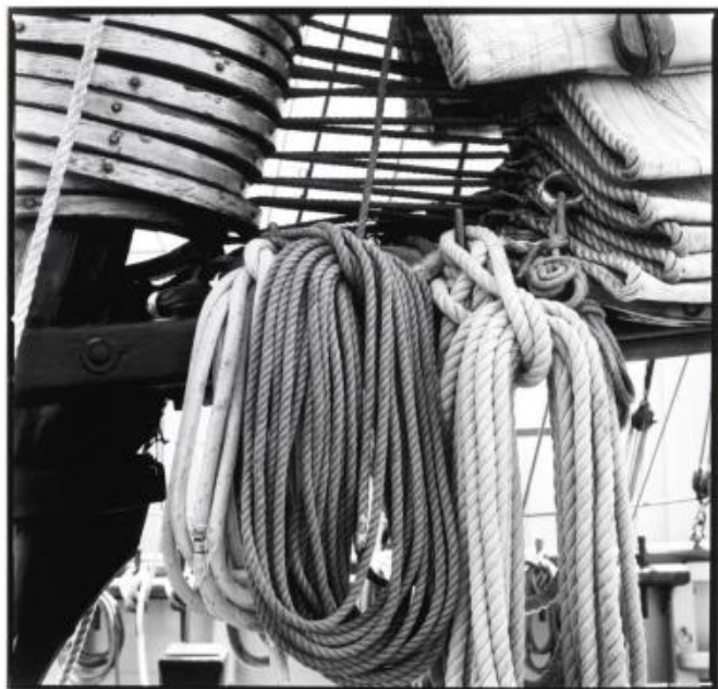
NY 835 : 62x62cm