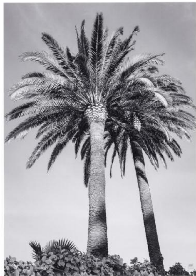
DA 501 : 75x95 cm