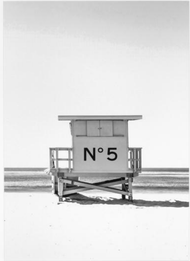
P 011 : 75X95 cm