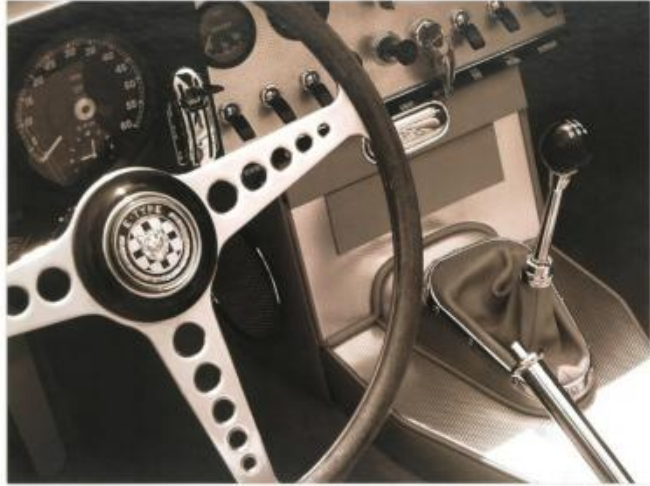
MC 014 : 52x62 cm