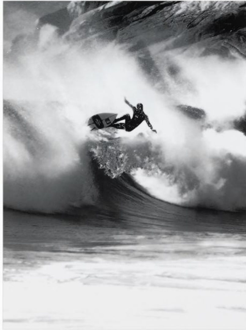
X 439: 80x100 cm