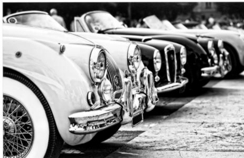
FSY 109 : 75x105 cm