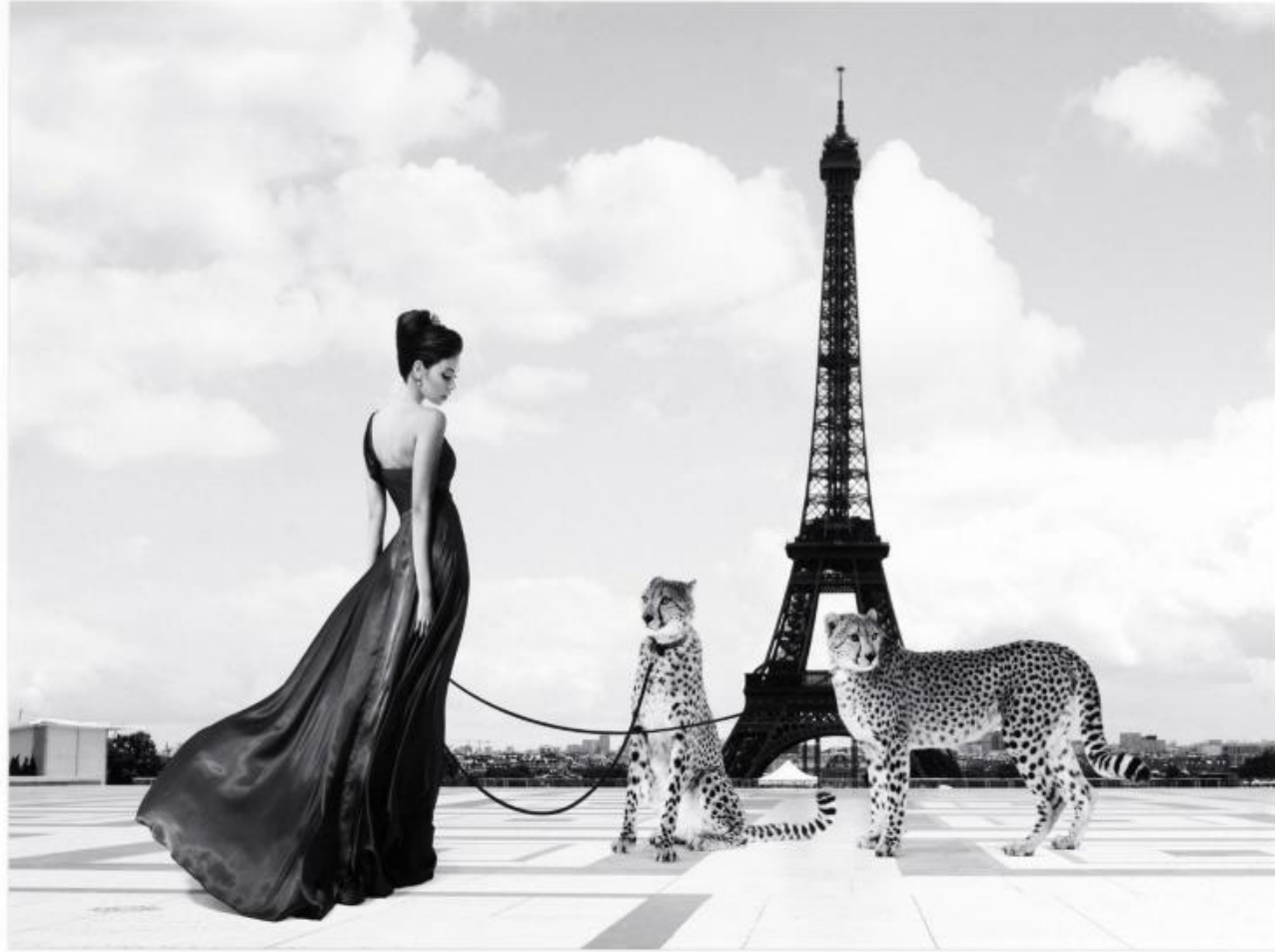
Q 223 : 85x105 cm