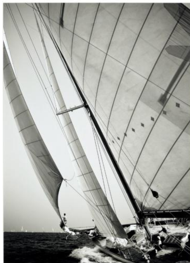
PEC 157 : 65x80 cm