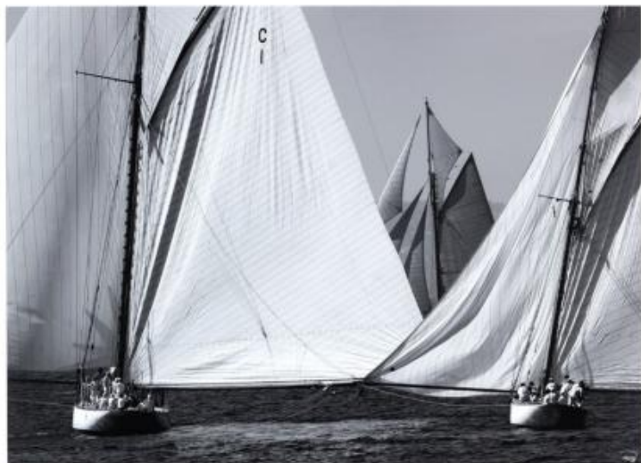
PEC 149 : 85x105 cm