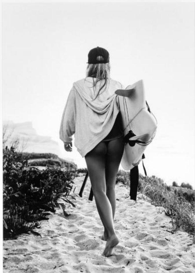
P 007 : 75X95 cm