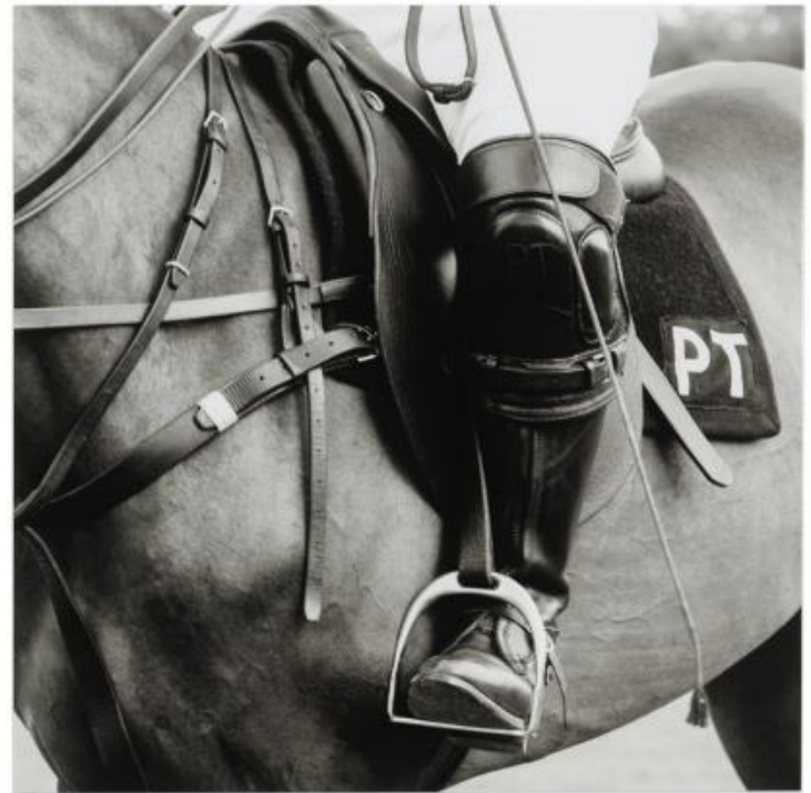
X 448: 70x70 cm