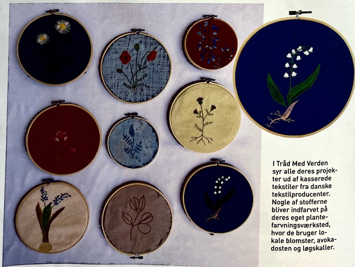
I Tråd Med Verden syr alle deres projekter ud af kasserede tekstiler fra danske tekstilproducenter. Nogle af stofferne bliver indfarvet på deres eget plante-farvningsværksted, hvor de bruger lokale blomster, avokadosten og løgskaller.

Omfavn dine fejl. Der er ingen grund til at være bange for, at dit projekt ikke bliver som planlagt. Det uperfekte er mindst lige så spændende, som det perfekte. For det uperfekte fortæller en mere nuanceret historie om personen bag. Samtidig kommer du nogle spændende veje hen undervejs, end hvis du havde fulgt vejen fra a til b.