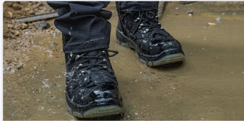
Mainly Outdoors, Sometimes Indoors