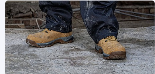
Always/Almost Always Indoors