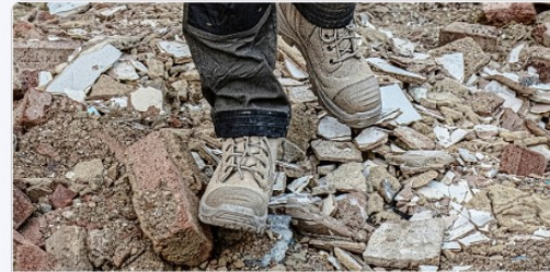
Mostly Indoors, Sometimes Outdoors