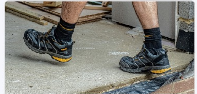
Dry - I don't deal with water