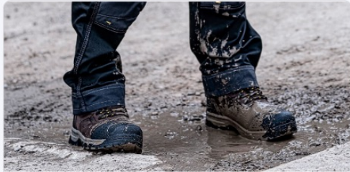
Always/Almost Always Outdoors

Where do you spend most of your working day?