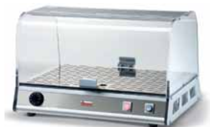
VISTA P1 BRIOCHE