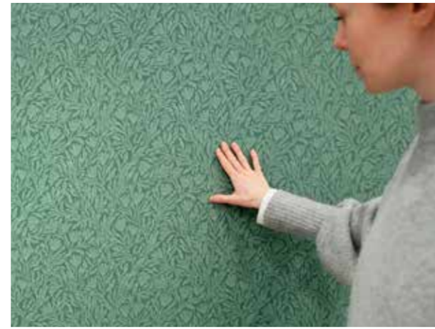
Karolina med grön Krokus på väggen.