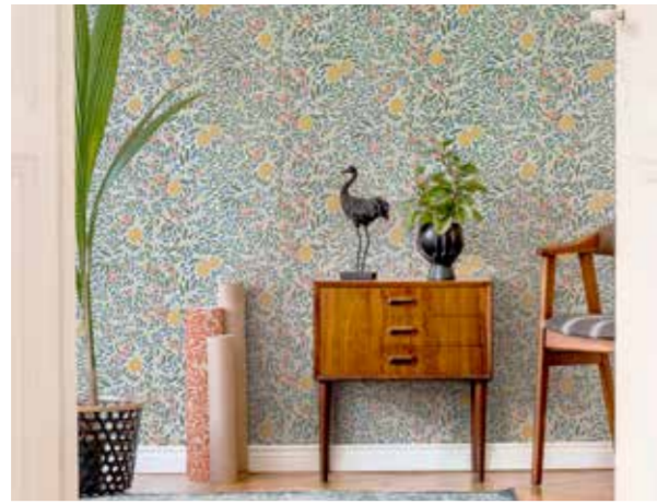
En citronträdgård inne.