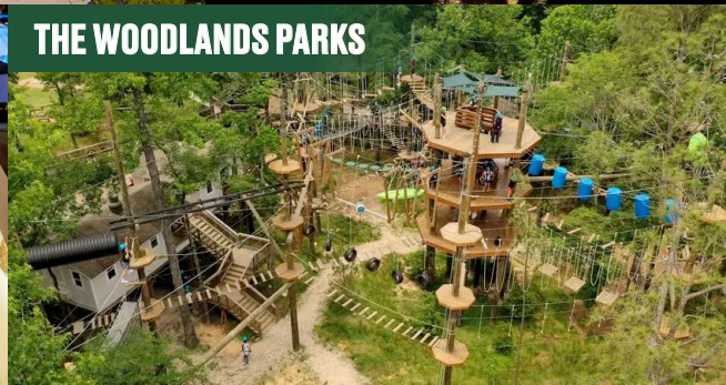
THE WOODLANDS PARKS