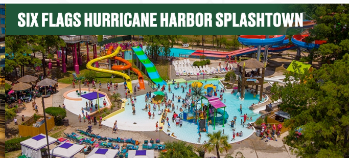
SIX FLAGS HURRICANE HARBOR SPLASHTOWN