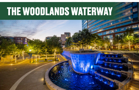
THE WOODLANDS WATERWAY

Ten la seguridad de que tu hijo no experimentará un momento aburrido en la ciudad más vibrante de los Estados Unidos. Con una abundancia de comodidades, actividades, parques y eventos, vivir aquí seguramente cautivará sus corazones.