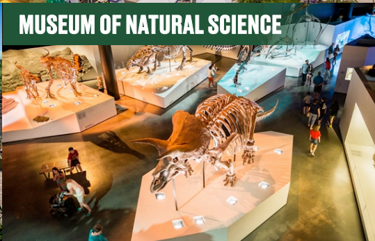
MUSEUM OF NATURAL SCIENCE