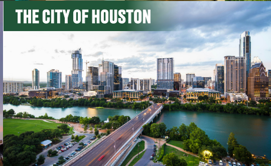
THE CITY OF HOUSTON