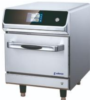
Cocción y Hornos - Horno de alta velocidad - Chef-N-Go!