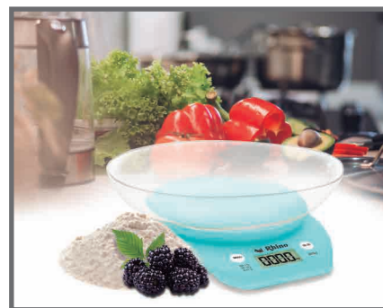
Incluye tazón desmontable

SERVICIO Y REFACCIONES DISPONIBLES Contamos con una red de centros de servicio en toda la república: rhino.mx/servicio.html