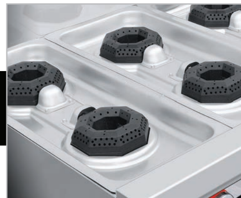
Cubierta semi-sellada, evita escurrimientos al interior.