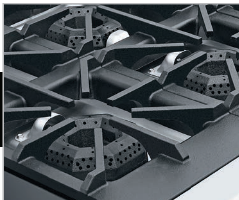
Robustas parrillas súper resistentes desmontables, facilitan la limpieza.

f/coriat.sobrinox t/coriat YouTube/GrupoCoriat