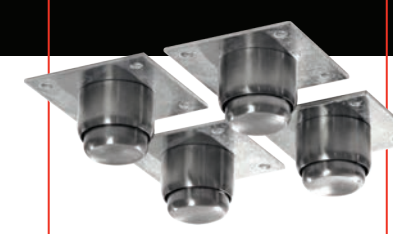
OPCIONAL: Base estructural o Kit de patas tubulares.