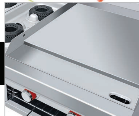
Plancha con exclusivo sistema para recolectar grasa y residuos.