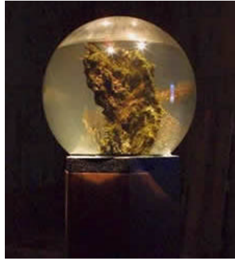
Ejemplo Ecosfera en Exposición - Museo del Mundo Marino (Huelva)