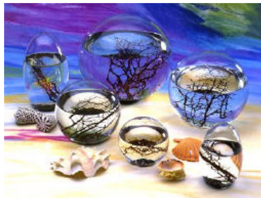
Los Seis Modelos de Ecosferas Comercializadas