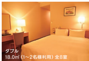
ダブル 18.0㎡ (1~2名様利用) 全8室