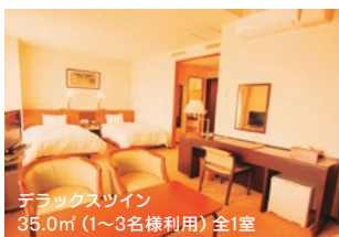
デラックスツイン 35.0㎡ (1~3名様利用) 全1室