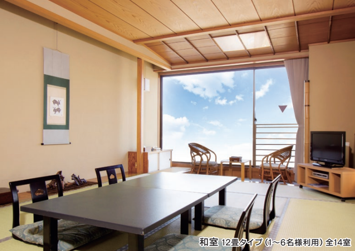
和室 12畳タイプ (1~6名様利用) 全14室

落ち着いた佇まいが心地いい和室やゆとりあるスペースのデラックスツインなど、リラックスしたひとときをお過ごし下さい。