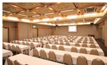
弁天の間 (研修会イメージ)

コンベンションホールをはじめ、大小広間では様々なご会合、会議など、人数や目的に合わせてご利用いただけます。 また、ギャラリーでは、昔懐かしい小物や創業時からのコレクションでもある、江戸時代の相撲錦絵など上質なひとときをお楽しみ下さい。