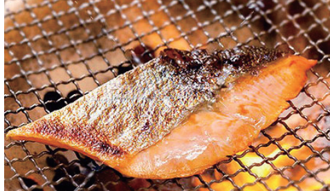
ご朝食は 炭火焼魚和定食

コンベンションホールをはじめ、大小広間では様々なご会合、会議など、人数や目的に合わせてご利用いただけます。 また、ギャラリーでは、昔懐かしい小物や創業時からのコレクションでもある、江戸時代の相撲錦絵など上質なひとときをお楽しみ下さい。