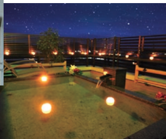
星空貸切露天風呂 (時間制・貸切り)

人エラジウム泉の大浴場、ゆったりと寛げる星空貸切露天風呂は身も心も温めてくれます。潮の香りと満天の星空に包まれながらゆるやかな時の流れをご体感下さい。