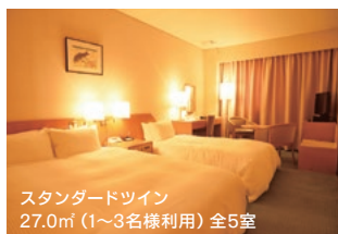
スタンダードツイン 27.0㎡ (1~3名様利用) 全5室

落ち着いた佇まいが心地いい和室やゆとりあるスペースのデラックスツインなど、リラックスしたひとときをお過ごし下さい。