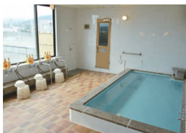
大浴場 (人エラジウム泉)