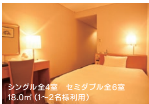
シングル全4室 セミダブル全6室 18.0㎡ (1~2名様利用)