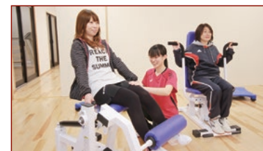
専用マシンを使用し、一人ひとりのペースで無理なく運動できます。

ご宿泊いただいているお客様は勿論、地域の方々にもお気軽にご利用いただける館内フィットネスジム。無理なく続けられる運動メニューなど、お泊まりの合間にお手軽エクササイズ。