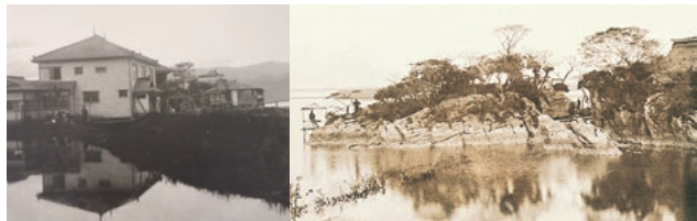
創業時（大正5年頃）の一景閣と一景島

「一景閣」の記憶を継承する原風景の再生は、震災復興を目指す私たちにあかりを灯し、創業から100年を超えた今、新しい世代にメッセージを伝えていきます。