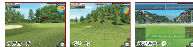
様々なモードでお楽しみいただけます。