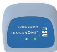
Cargador Externo Inogen G5