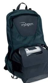
Mochila de Transporte