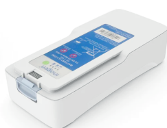
Batería Doble 13 Hrs de Autonomía