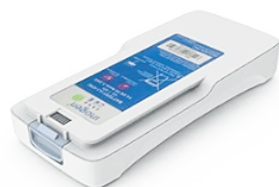
Batería Simple 6.5 Hrs de Autonomía