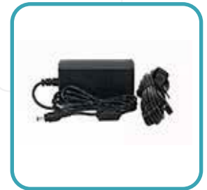
Adaptador de CA Cable de Alimentación