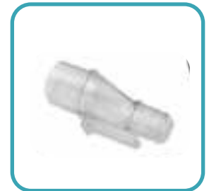
Adaptador Tubo CPAP