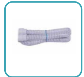
Tubo CPAP Delgado 8 "