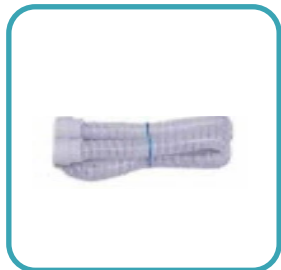
▶ Tubo CPAP Delgado 4 pies