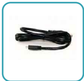
▶ Cable USB