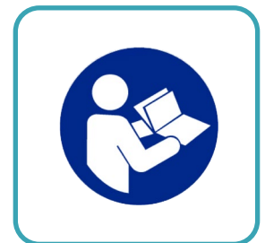
Manual de Uso