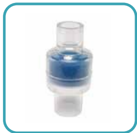
▶ Intercambiador de Calor / HME