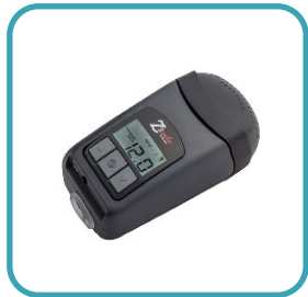
▶ Dispositivo CPAP Z2