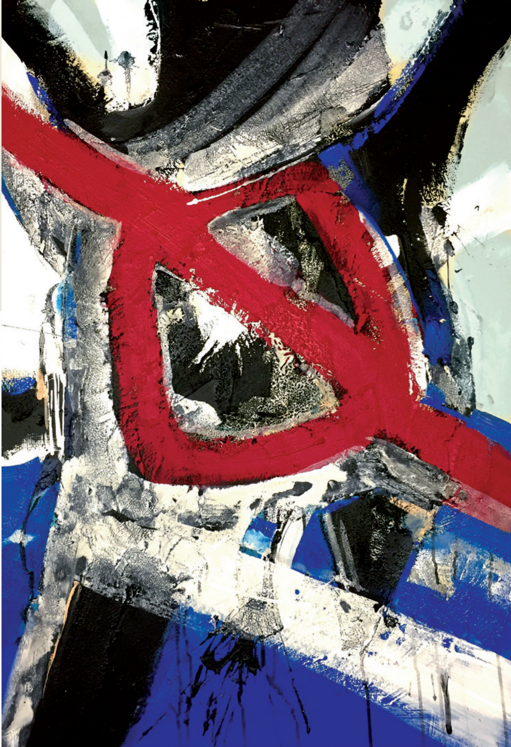
„Wrong way“, Acryl auf Leinwand

„Recht ohne Gerechtigkeit ist wie ein Bild ohne Farben.“