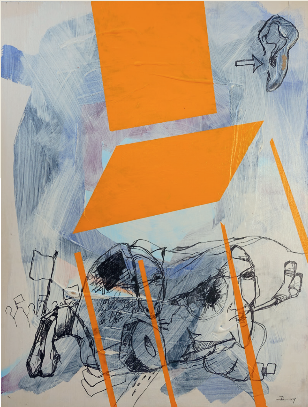
„Die Revolution beginnt“, Acryl und Bleistift auf Holz

„Kunst ist die Stimme der Veränderung und das Gewissen des Rechts.“