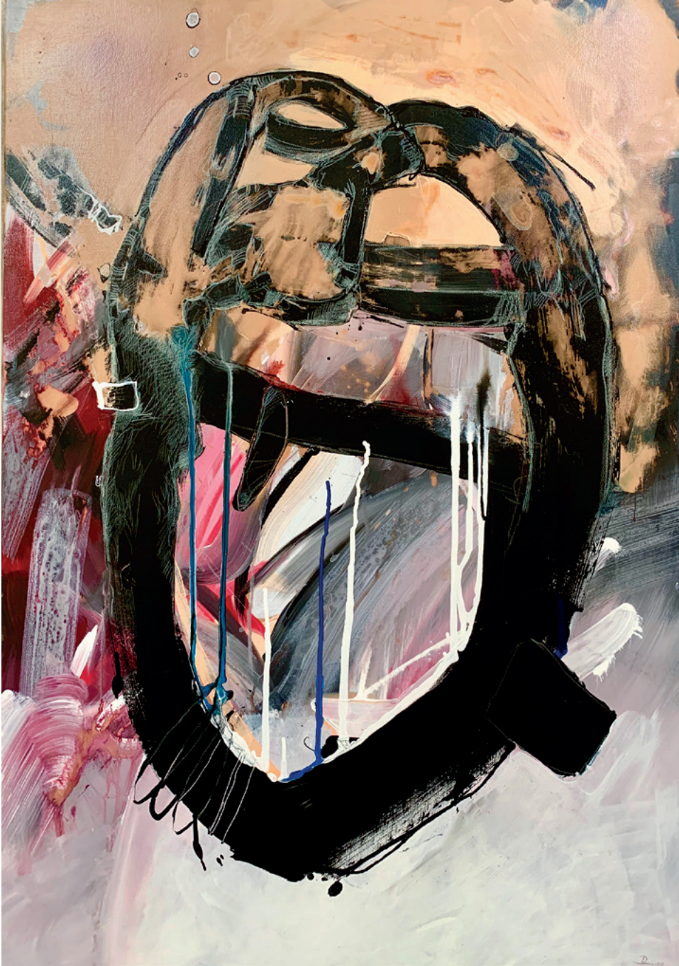
„Artefakt“, Acryl auf Leinwand

„Die Kunst ist die Waffe des Geistes gegen die Unbilligkeit der Welt.“