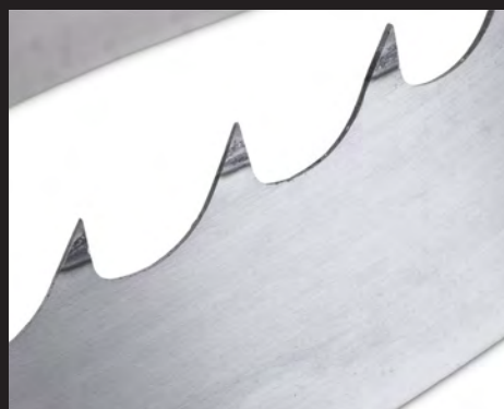
À CREUX PROFOND