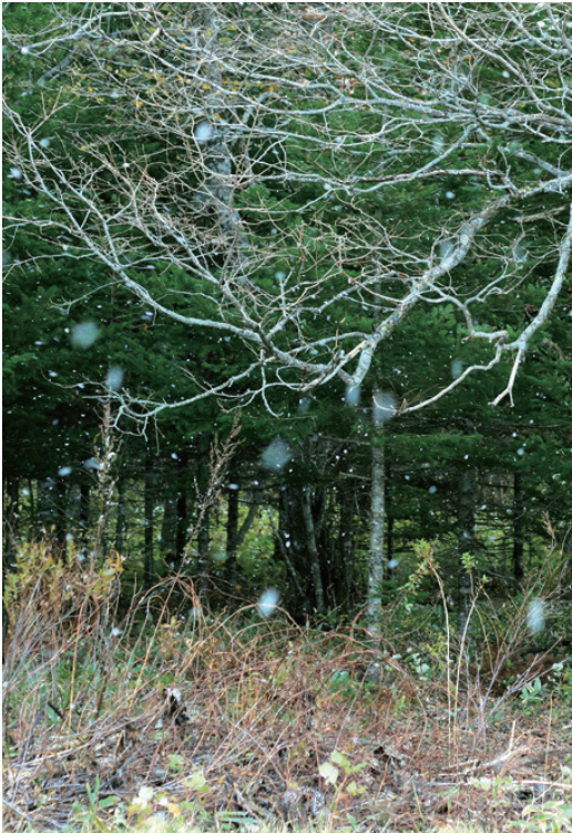
今年の初雪は10月26日。例年より少し早い初雪でした。