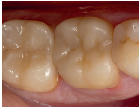
Corona in SHOFU Block HC Hard sul dente 46

SHOFU Block HC Hard è particolarmente interessante anche per dentisti che desiderano offrire ai propri pazienti restauri estetici di denti singoli realizzati alla poltrona, caratterizzati da una lunga durata, da rapporti occlusali stabili a lungo termine, dal rispetto degli antagonisti e che possono essere rifiniti con un enorme risparmio di tempo.