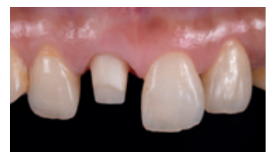
Restauro: Shinya Kuramoto, CDT Iwata Dental Office, Giappone

Se necessario, i restauri monolitici realizzati con SHOFU Disk ZR Lucent Supra possono essere ottimizzati a livello estetico e sigillati con i supercolori e masse di glasura Vintage Art Universal. Se si desidera perfezionare esteticamente una struttura ridotta, si può completare la forma anatomica con le masse dentina e smalto Vintage ZR.