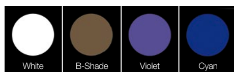
In condizioni di luce naturale

I supercolori in pasta LITE ART sono altamente fluorescenti proprio come i denti naturali. L'effetto naturale è mantenuto anche in condizioni di illuminazione artificiale.