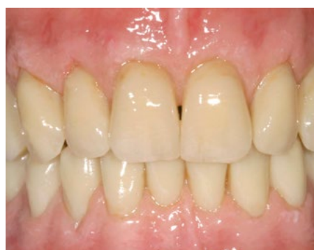
Denti superiori 13-23 e gengiva individualizzati con LITE ART e Ceramage.