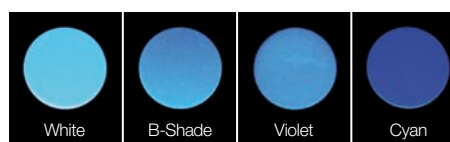
Alla luce ultravioletta persino i colori scuri riflettono in modo vitale e naturale