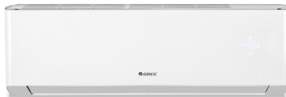
Unité murale Extreme