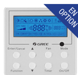
Thermostat filaire (XE-71)