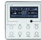
THERMOSTAT (Inclus) XK19