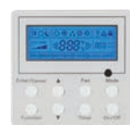
THERMOSTAT (Facultatif) XE71