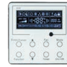
THERMOSTAT (Inclus) XK19