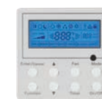
THERMOSTAT (Facultatif) XE71