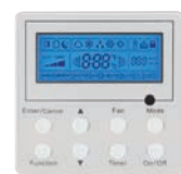
THERMOSTAT (Optional) XK60