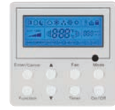
THERMOSTAT (Facultatif) XK60