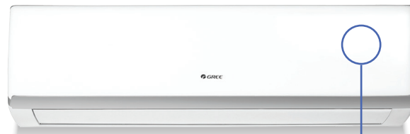
Unité murale LOMO