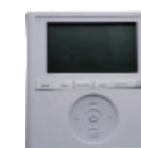
Télécommande filaire (programmable sur 7 jours) KSACN0401AAA

Télécommande filaire en option KSACN0401AAA (programmable sur 7 jours)