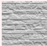
サイディングボード