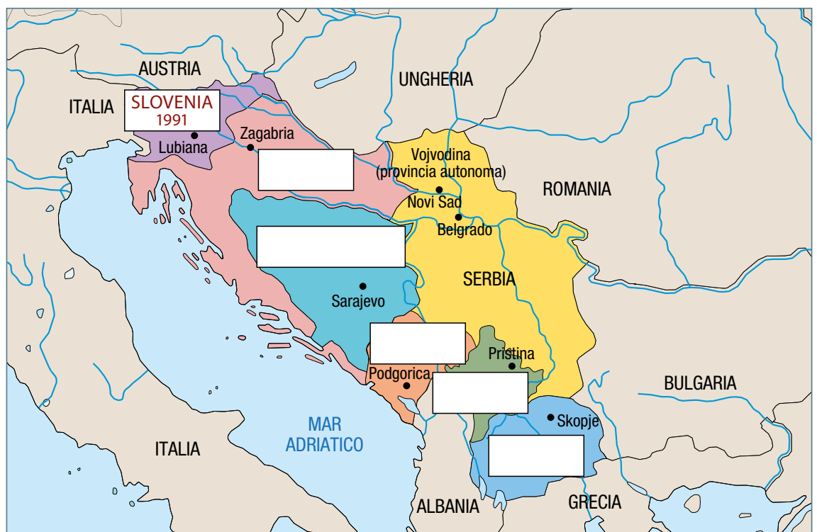
Gli Stati costituiti dopo il crollo della Jugoslavia