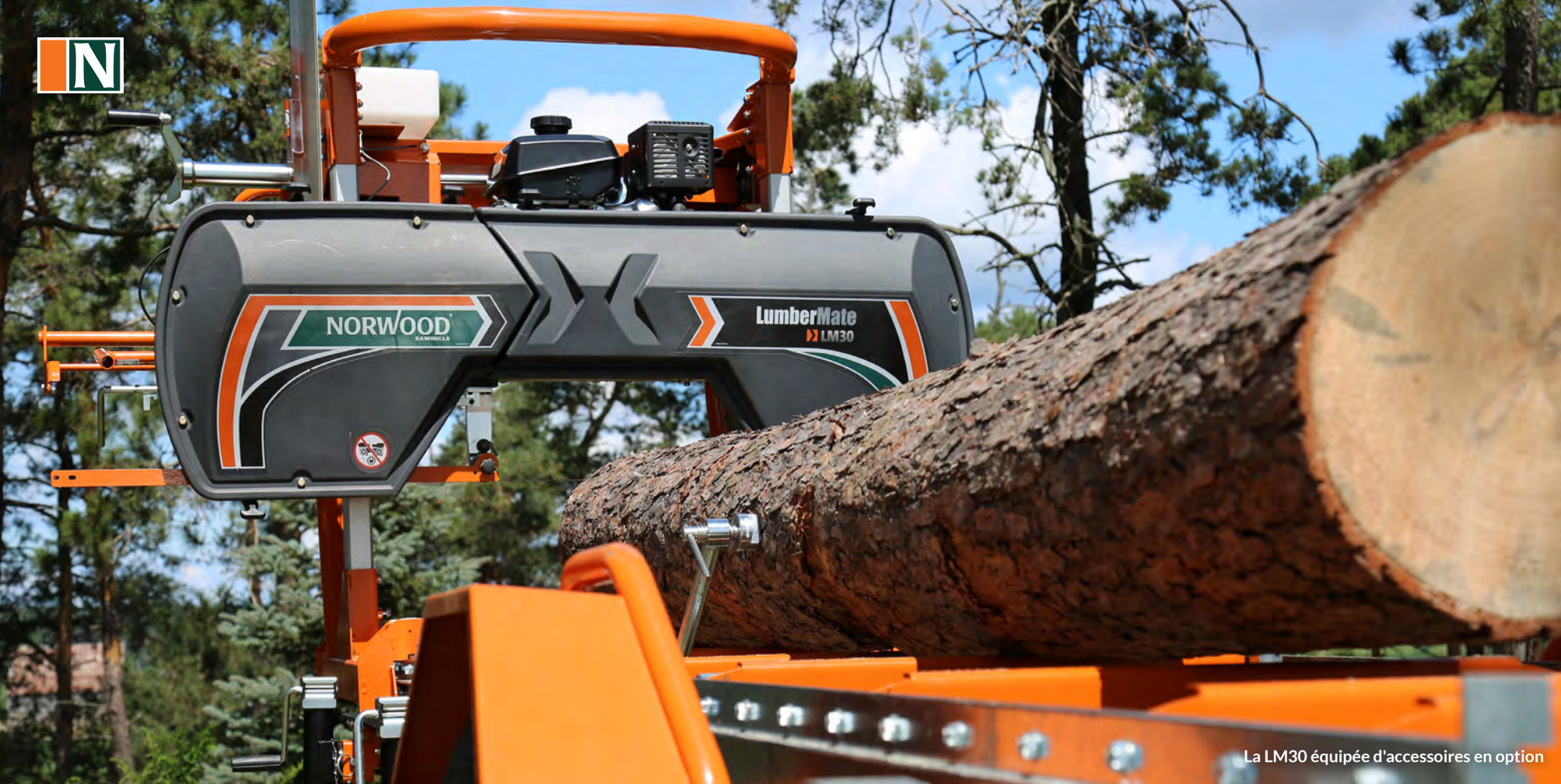
La LM30 équipée d'accessoires en option