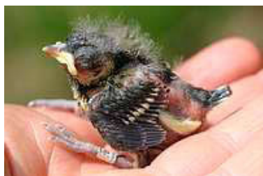
9 dagen. Soms ogen open. Code N5.