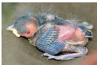
6 dagen. Slagpennen in begin van pin. Code N4.