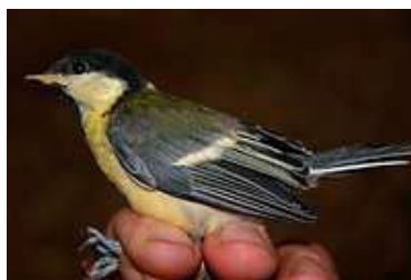
18 dagen. Let op terugtrek mondhoekplooi. Code N7.