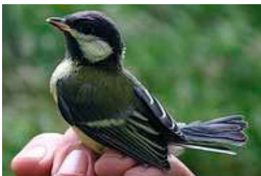
17 dagen. Let op terugtrek mondhoekplooi. Code N6.