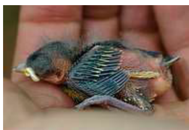
7 dagen. Slagpennen nog net in pin. Code N4.