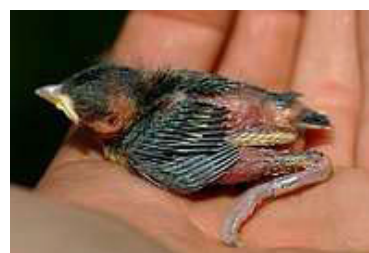
8 dagen. Let op veren op rug en nek. Veren net uit bloedspoel komend. Code N5