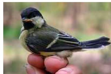
19 dagen. Uitvliegtag. Code N7.