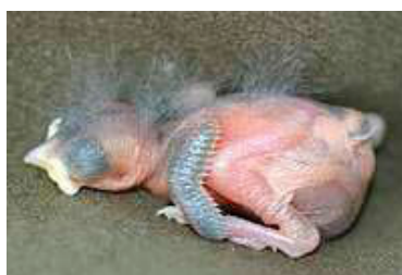
4 dagen. Let op begin van verengroei rug. Code N1/N2.