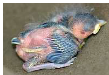
5 dagen. Begin pinnetjes slagpennen. Code N1/N2.