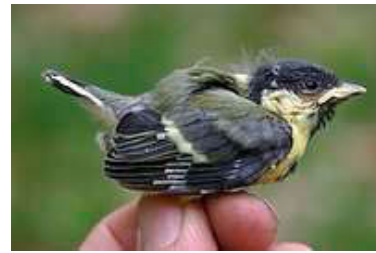
13 dagen. Let op lengte veer uit bloedspoel. Code N5.