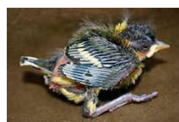
10 dagen. Veervorm op spoel herkenbaar. Code N5.