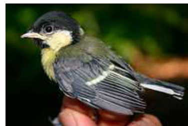
16 dagen. Let op lengte slagpennen. Code N6.