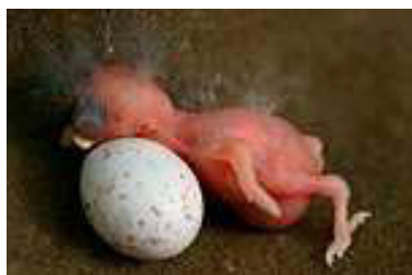
0 dag. Donkerrode huid. Code N0.

Op deze kaart zijn foto's van de koolmees als voorbeeld gehanteerd, maar deze foto's van de ontwikkeling van de groei in het neststadium is bruikbaar voor alle mezensoorten.