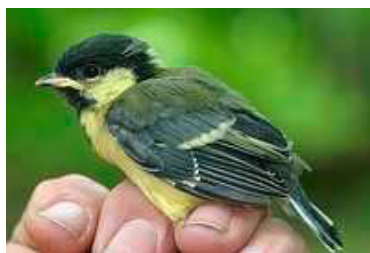
15 dagen. Let op lengte slagpennen. Code N6.