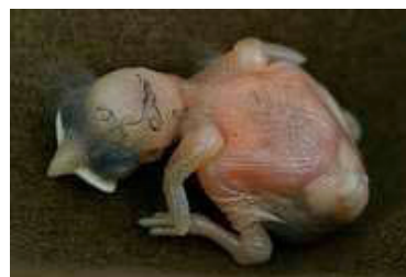
2 dagen. Puntjes op vleugel zichtbaar. Code N1.