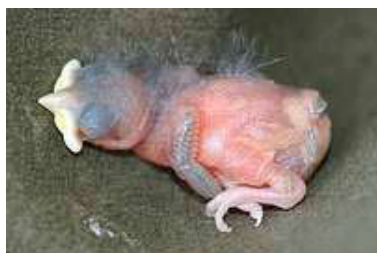
3 dagen. Kleur van veren op vleugel. Code N1/N2.