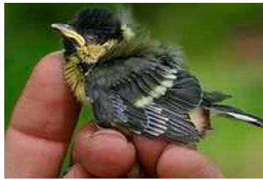
12 dagen. Let op lengte veer uit bloedspoel. Code N5.