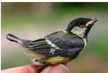
14 dagen. Slagpennen half volgroeid. Code N6.