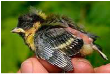
11 dagen. Let op lengte veer uit bloedspoel. Code N5.