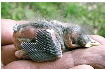
9 dagen. Let op lengte nu nog gesloten bloedspoolen Code N5.