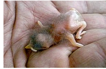
2 dagen. Slechts verschil in lichaams grootte. Code N1.