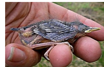
12 dagen. Let op lengte veer uit bloedspool. Code N5.