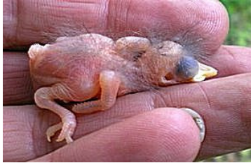
3 dagen. Begin tekening veren op vleugel. Code N1/N2.