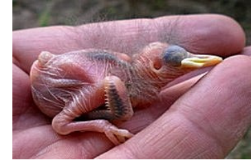
5 dagen. Aanzet van groei van de rugveren. Code N1/N2.