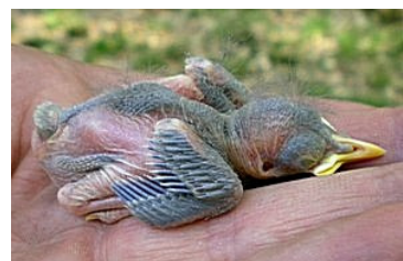
8 dagen. Kleine dekveren nu ook in begin van bloedspool. Code N5