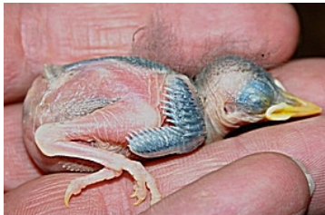
6 dagen. Slagpennen duidelijk in begin van pin. Code N4