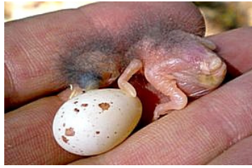
1 dag. Let op grootteverschil met evt. nog aanwezig ei. Code N1.