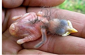
4 dagen. Verengroei op vleugel duidelijker. Code N1/N2.