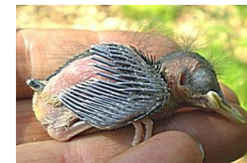
10 dagen. Begin van spruiten veer uit bloedspool. Code N5.