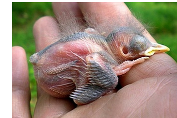
7 dagen. Spruit slagpennen groeiend. Code N4