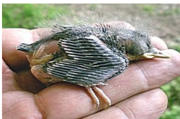
11 dagen. Let op lengte veer uit bloedspool. Code N5.