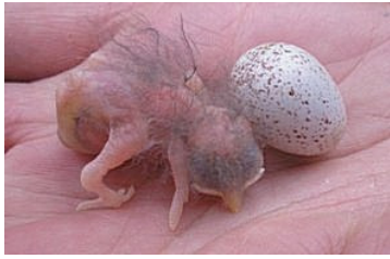
0 dag. Donkerrode huid. Code N0.