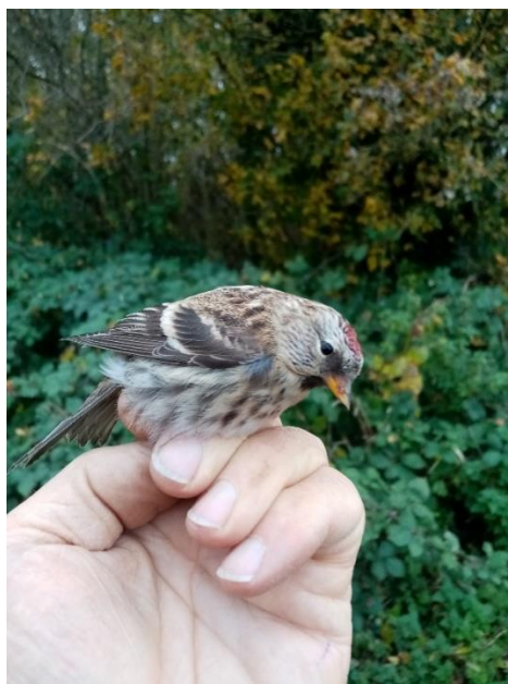
Grote barmsijs man 1 kj