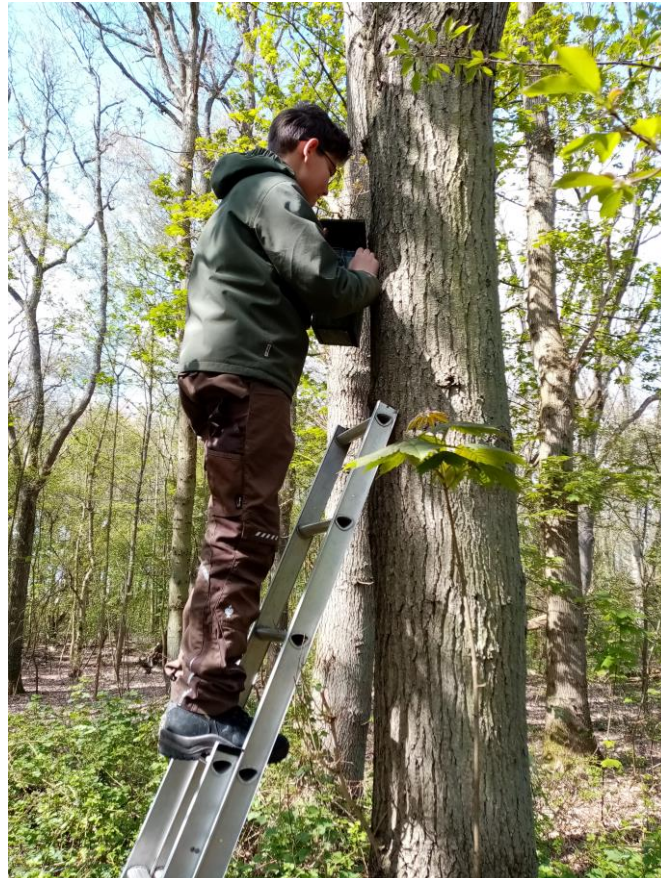
Nathan controleert en fotografeert

C20: 26/04 1 ei; 01/05 6 ei; 06/05 7 ei; 13/05 11 ei; 19/05 14 ei, pas de eerste kans vrouw te controleren. Als op 02/05 het zevende eitje gelegd zou zijn, hadden er op 19/05 jongen moeten zijn! Moet dus wel vervolgbroedsel betreffen; 06/06 6 pullen geringd, 7 ei over.