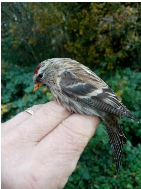
Kleine barmsijs vrouw

Op de laatste dag van de maand weinig te halen in de Voorboezem. Nog wel 1 Ringmus . Overstap naar Leemans, tot donker, levert nog 3 Koperwieken op.