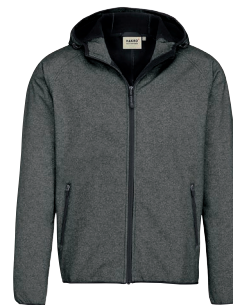
328 anthrazit meliert