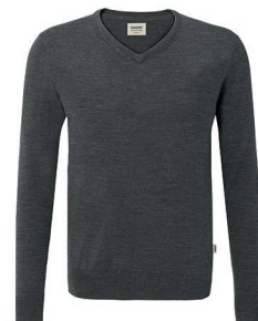
328 anthrazit meliert