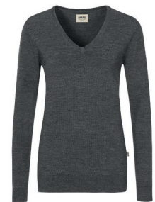
328 anthrazit meliert