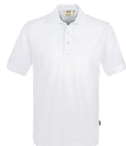
401 hp weiß

Ursprungsland Türkei Zolltarifnummer 6105 2010 Datenblatt Stand: 02/2023