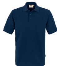
434 hp tinte