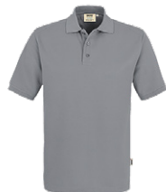
443 hp titan