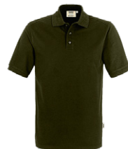
465 hp olive