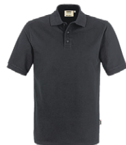
464 hp karbongrau