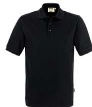
405 hp schwarz